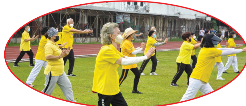
Suasana latihan taichi bersama.