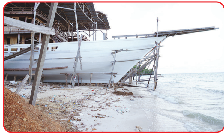
Penampakan kapal rumah sakit pengganti Bahenol sedang dalam tahap pengerjaan.