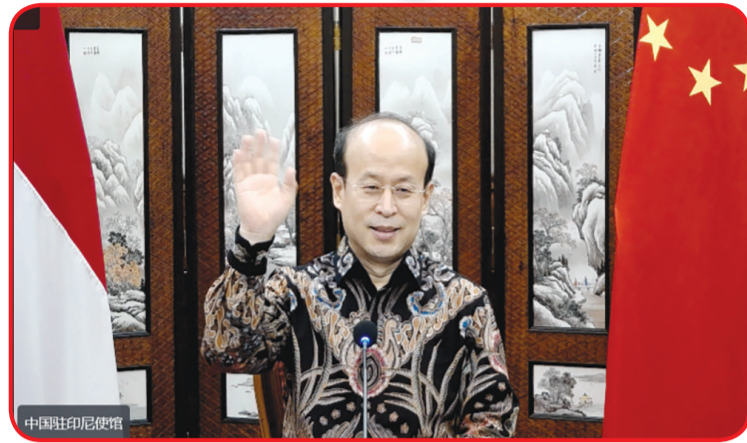
Dubes Tiongkok Xiao Qian.