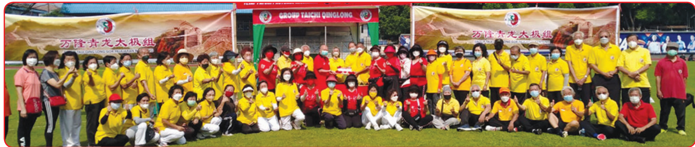
Seluruh tokoh yang hadir berfoto bersama.