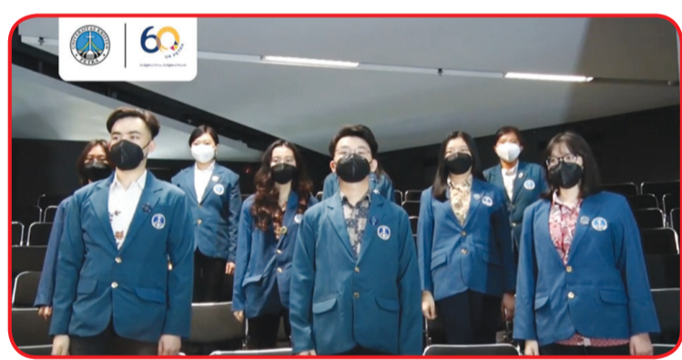
Peserta upacara Peringatan Hari Sumpah Pemuda.