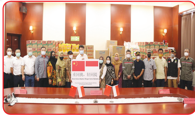
Suasana penyerahan bantuan sembako dan bantuan APD kepada warga desa.

JAKARTA (IM) - Dubes Tiongkok untuk Indonesia Xiao Qian Selasa (26/10) lalu menghadiri prosesi serah terima bantuan sembako dan bantuan APD dari Kedubes Tiongkok di Indonesia kepada warga di enam desa sekitar terowongan No 1 Kereta Cepat Jakarta-Bandung secara online.