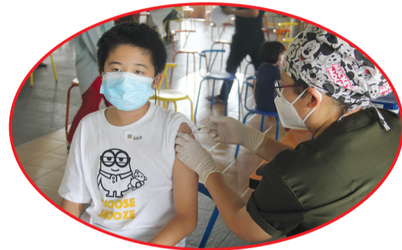
Remaja yang sedang divaksin.