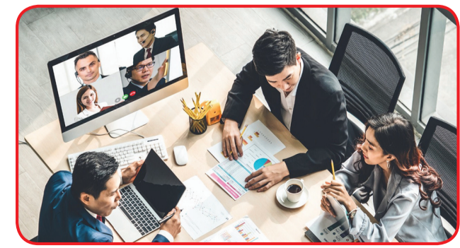
Kalbis Institute membuka program Management in Family Business.