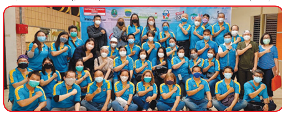
Seluruh pimpinan dan anggota MTP Bandung berfoto bersama.

Vaksinasi penting untuk kesehatan diri sendiri dan kesehatan keluarga dan tetangga. Namun setelah divaksinasi kita tetap harus mematuhi protokol kesehatan dengan baik dan jangan lengah. "Kita harus mengenakan dan jangan berkerumun. Diharapkan wabah Covid-19 ini dapat segera berlalu dan kita semua bisa hidup dengan tenang," ujarnya. • idn/din