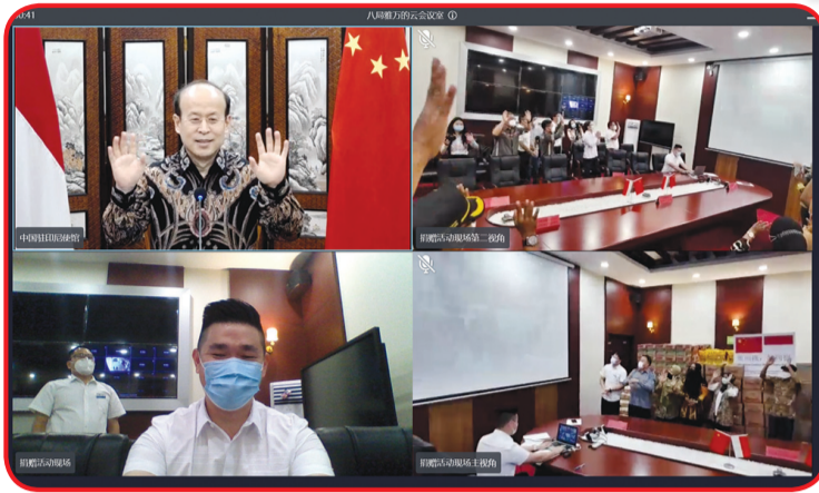
Dubes Tiongkok menghadiri serah terima bantuan sembako dan bantuan APD kepada warga desa.